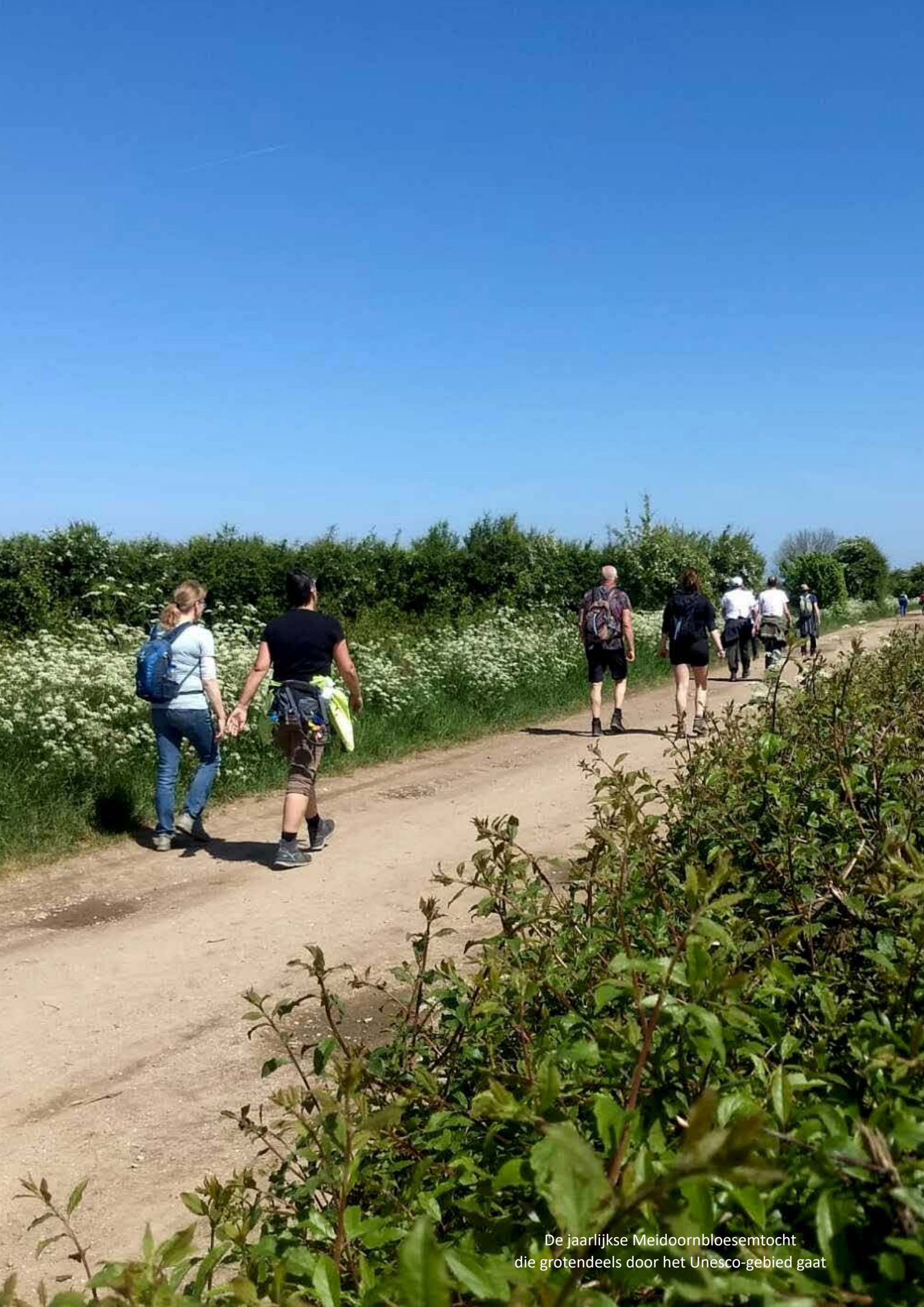
De jaarlijkse Meidoornbloesemtocht die grotendeels door het Unesco-gebied gaat