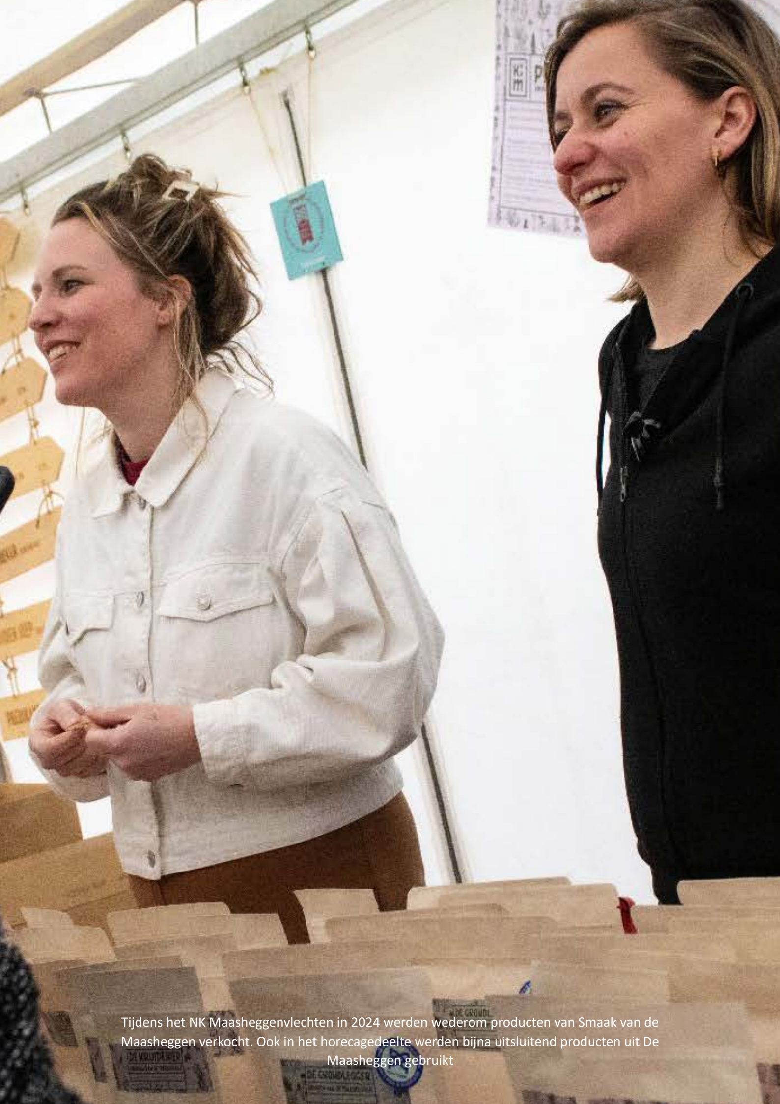
Tijdens het NK Maasheggenvlechten in 2024 werden wederom producten van Smaak van de Maasheggen verkocht. Ook in het horecagedeelte werden bijna uitsluitend producten uit De Maasheggen gebruikt