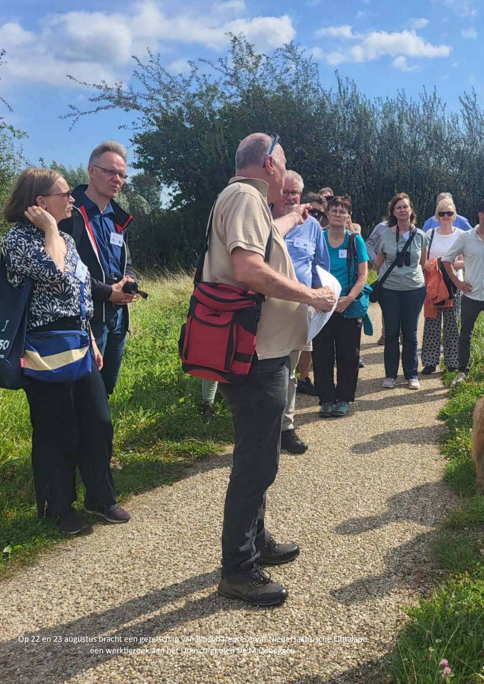
Op 22 en 23 augustus bracht een gezelschap van Biosphaerreservaat Niedersächsische Elbtalaue een werkbezoek aan het Unesco-gebied De Maasheggen